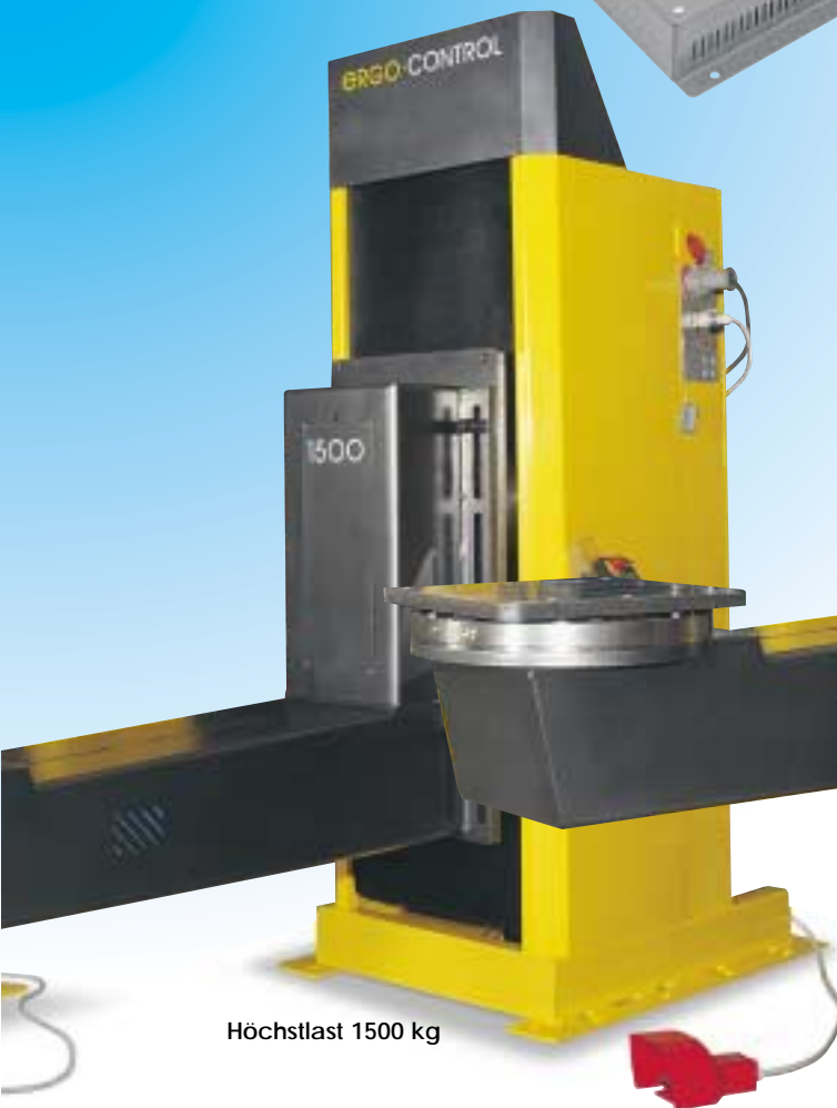
Höchstlast 1500 kg