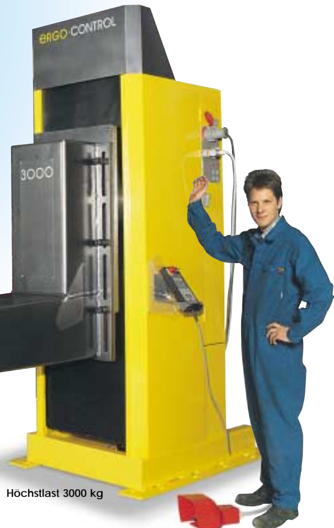
Höchstlast 3000 kg