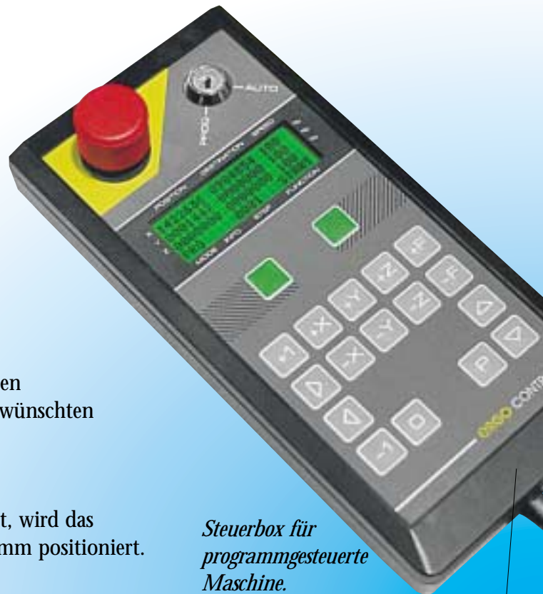
Steuerbox für programmgesteuerte Maschine.

Unsere Positionierer haben ein doppeltes integriertes Sicherheitssystem, das dafür sorgt, dass z. B. bei plötzlichen Stromausfällen oder ähnlichem keine unerwartete Bewegung geschieht.