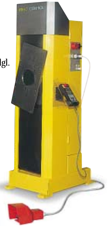
Positionierer auf Wunsch auch ohne Arm lieferbar (mit 2 Achsen)