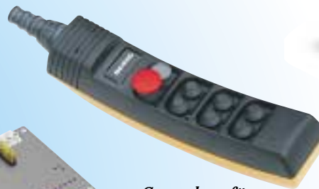
Steuerbox für manuellen Betrieb