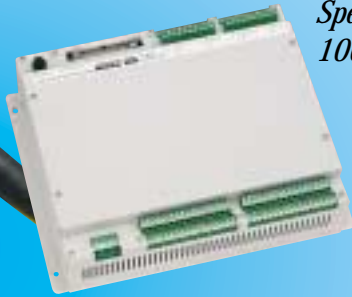
Steuersystem mit Speicherkapazität von 1000 Positionen